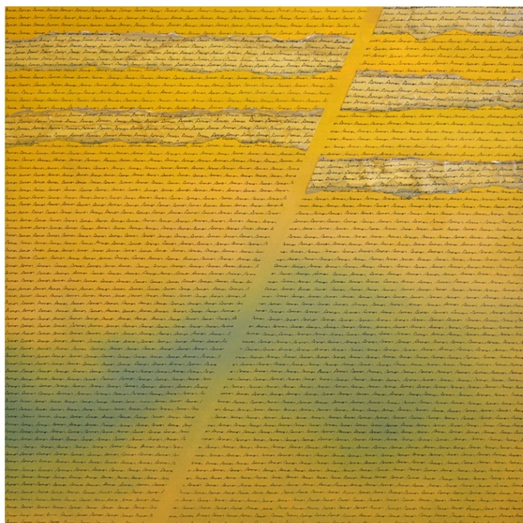
Sormano: poetica pendenza 2019 acrilico, collage e inchiostro su tela cm. 70x70

GLI ARTISTI GIANNETTO BRAVI E MARCO ESTEBAN CAVALLARO HANNO LAVORATO SUL TEMA DELLA RIPETITIVITA'. SCEGLI UNA PAROLA CHE TI PIACCIA MOLTO E SCRIVILA PIU' VOLTE SUL FOGLIO, IN VERTICALE, IN ORIZZONTALE, IN DIAGONALE, ANCHE SOVRAPPONENDO ALCUNE LETTERE AD ALTRE E UTILIZZANDO DIVERSI COLORI.