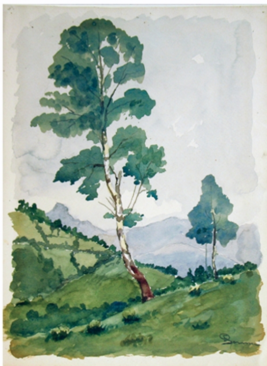
Betulla, aquarello su carta cm. 29,2x39,5