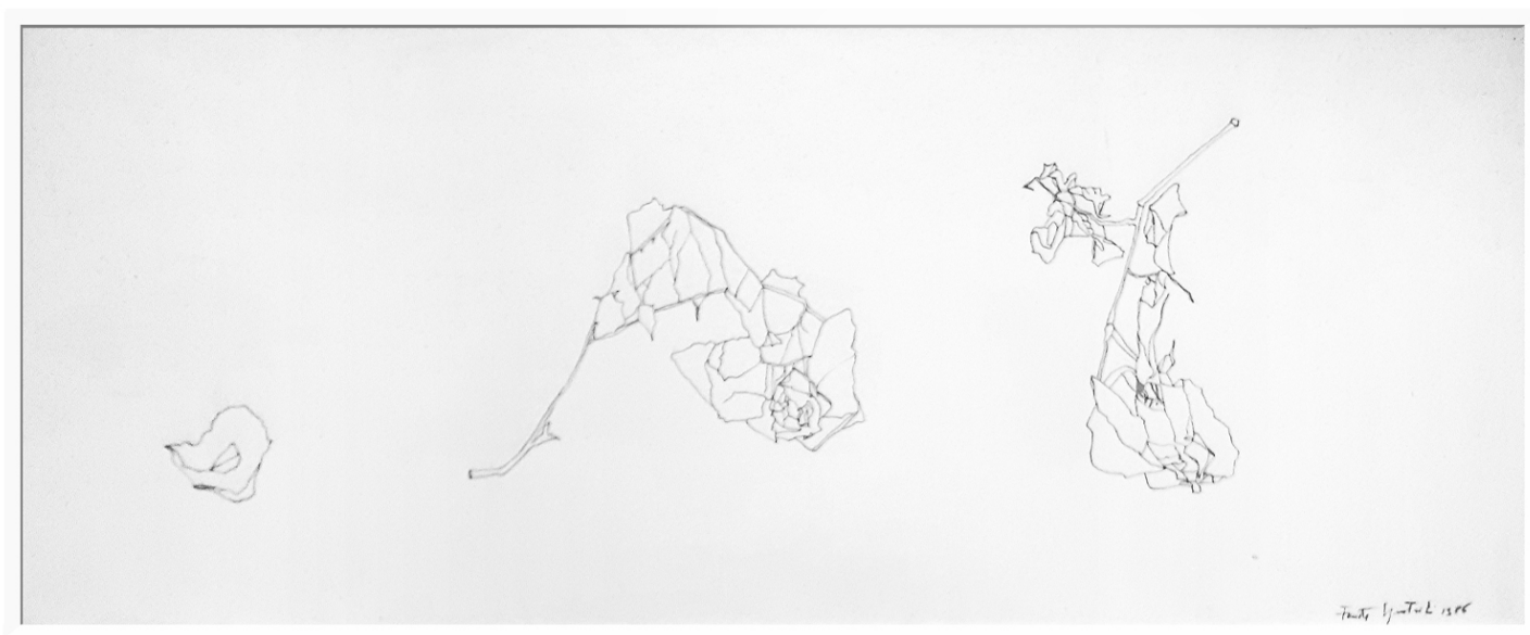
Fausta Squatriti - 1986 - inchiostro su carta cm.27,5x68,5

L'ARTISTA FAUSTA SQUATRITI HA DISEGNATO UNA ROSA IN DIVERSE POSIZIONI. UN ESERCIZIO IMPORTANTE PER ESERCITARSI NEL DISEGNO E' LA "COPIA DAL VERO". GUARDATI INTORNO, SCEGLI UN OGGETTO CHE TI PIACE E COPIALO SU UN FOGLIO.