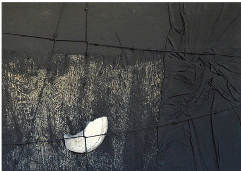
Intreccio di mondi 1, 2008 Legno, corda, tela di cotone, tela di corteccia di lianchama e frammento di ceramica Shavi cm.70x50