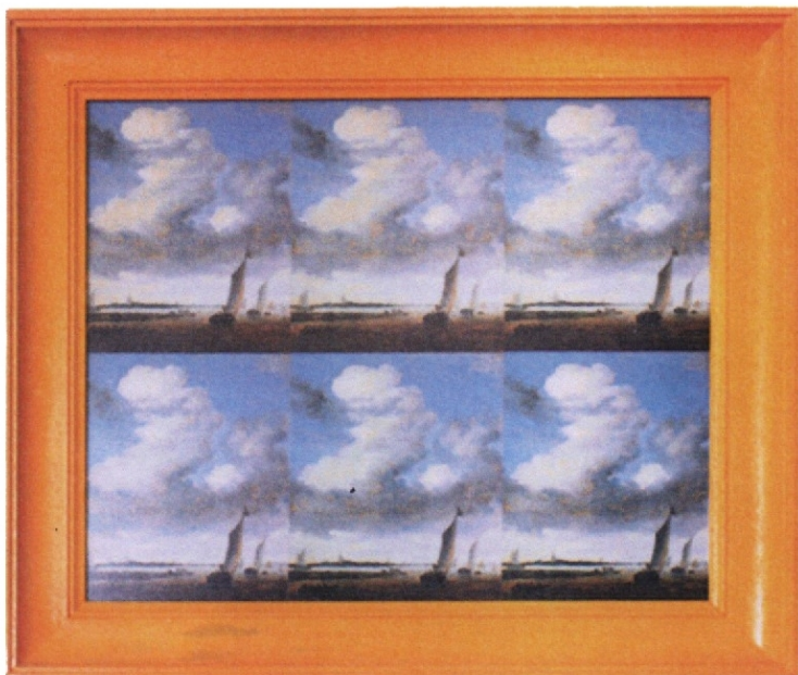
Giannetto Bravi titolo: quadreria d'arte 2003 - cm.32x39 più cornice