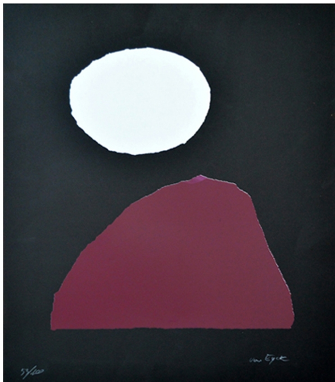
Veronica van Ejck, Luna ( Leopardi) serigrafia cm.50x65, 53 su 100

LA SERIGRAFIA DELLA SCULTRICE VERONIKA VAN EYCK E' ISPIRATA AD UNA POESIA DI GIACOMO LEOPARDI DAL TITOLO "LA LUNA".