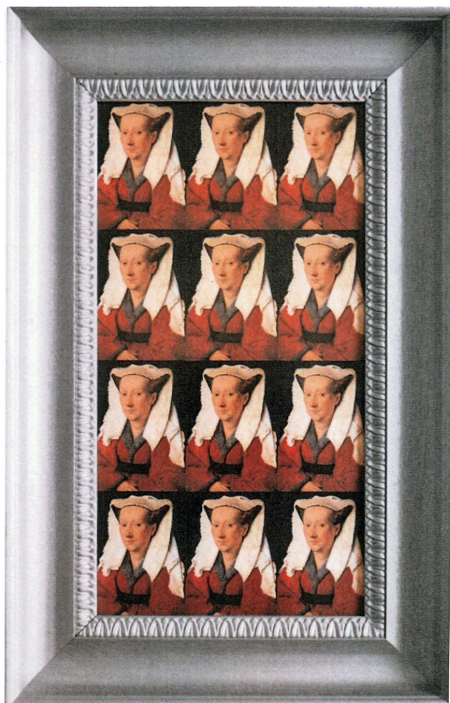
Giannetto Bravi -quadreria d'arte - 2003 cm.31,5x60 più cornice