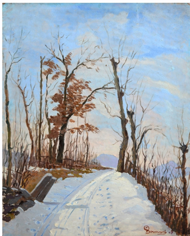
Paesaggio innevato, 1947 olio su tela cm. 40x50