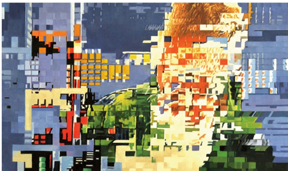
Perturbazione n. 19, 2016 olio su tela cm.50x30

LE OPERE RECENTI DI ANTONIO SORMANI SONO INTITOLATE "PERTURBAZIONI". SI TRATTA DI DIPINTI A OLIO SU TELA REALIZZATI ELABORANDO IMMAGINI FOTOGRAFICHE DI TRASMISSIONI TELEVISIVE DISTURBATE (QUANDO LA TV "FA LE RIGHE"). ATTRAVERSO LE LINEE DI DIVERSI COLORI ELABORA UN TUO PERSONALE PAESAGGIO.