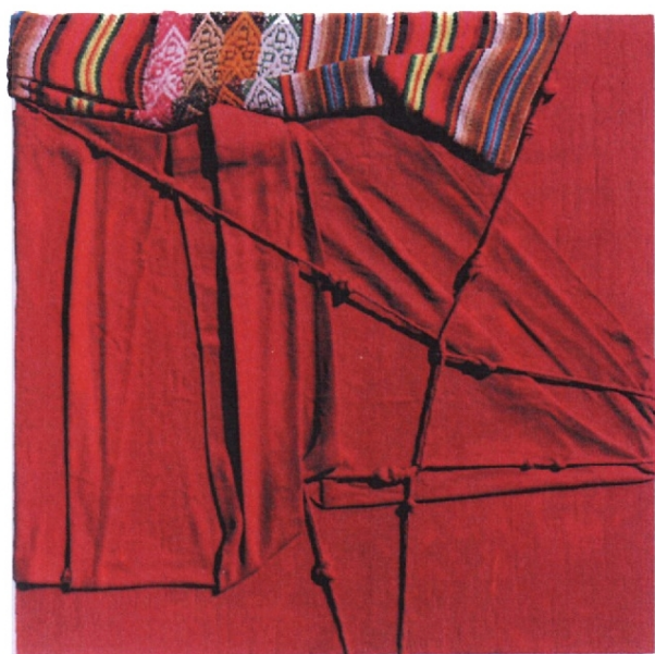
Antonella Prota-Giurleo Fili sul mare Oceano - 2008 - tela di cotone, frammento di manta, corda e pigmento su tavola cm.30x30