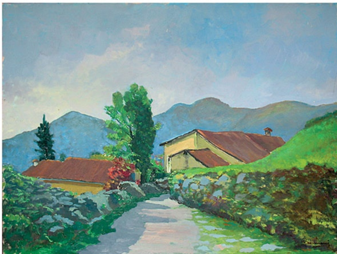
Sormano, la chignola, olio su tela cm. 70x50

APPOGGIA IL FOGLIO AL VETRO DELLA FINESTRA E RICALCA PIU'VOLTE, ANCHE SOVRAPPONENDO LE LINEE, IL CONTORNO DELLE MONTAGNE O DELLE COLLINE CHE VEDI.