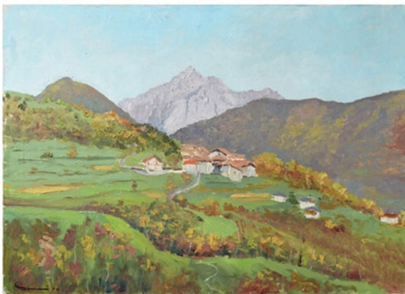
Senza titolo, 1970 olio su tela cm,70x50

I DIPINTI A OLIO E GLI ACQUARELLI DI GIOVANNI SORMANI RAPPRESENTANO PAESAGGI DEL TERRITORIO DEI MONTI DI SERA: SORMANO, CAGLIO, REZZAGO, BRAZZOVA, SPEZZUOLA, CHIGNOLA.