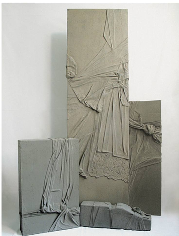
L'archetipo, la dea, 2007 installazione legno, tela, cenere, colla di coniglio, corda. 3 pezzi cm. 40x140x12 cm. 40x60x12 cm.33x77x12

ANTONELLA PROTA –GIURLEO AMA UTILIZZARE, NELLE SUE OPERE, MATERIALI ECOCOMPATIBILI O DI RECUPERO. RICORDI QUALCUNO DI QUESTI MATERIALI? UTILIZZA PEZZI DI CARTA, LETTERE, BIGLIETTI E REALIZZA UN COLLAGE ASTRATTO.